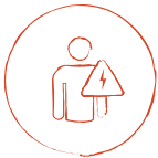
Dolor o presión en el pecho (angina)