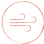
Dificultad para respirar