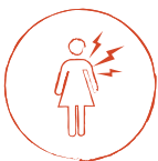
Malestar en espalda, hombros, brazos, mandíbula, cuello