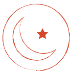
Insomnio o incapacidad para dormir