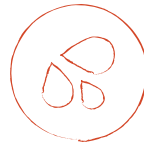
Sudoración profusa repentina