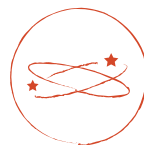
Aturdimiento o mareos