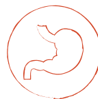
Nauseas o vomitos